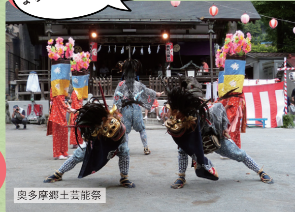
奥多摩郷土芸能祭