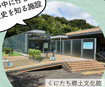
くにたち郷土文化館