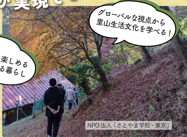
NPO法人「さとやま学校・東京」

■旅行代金：0円（無料） ※集合・解散場所までの往復交通費、個人的な買物・飲食は各自負担となります。 ※旅行代金は東京都が移住・定住事業の一環として負担しています。 ※お客様都合による旅程変更に伴い発生する交通費等は自己負担になります。