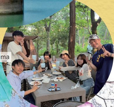
Grow Garden Toriyama

買い物など日常生活がしやすい利便性と、多摩地域らしい自然をバランスよく取り入れた東大和市。新宿方面まで約 35 分、立川方面まではモノレールで約 10 分のアクセスの良さと落ち着いた住環境が魅力です。身近に公園も多いため、多くの子育て世帯に選ばれています。