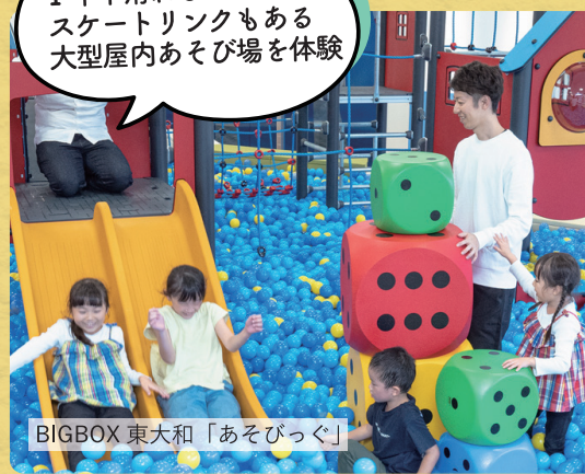
BIGBOX 東大和「あそびっく」