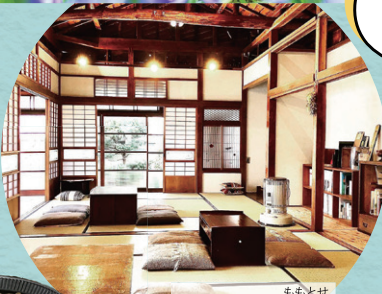
ももとせ 縁ひらく庭 百才