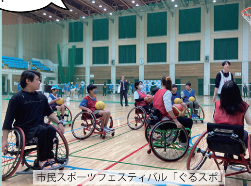
市民スポーツフェスティバル「ぐるスポ」