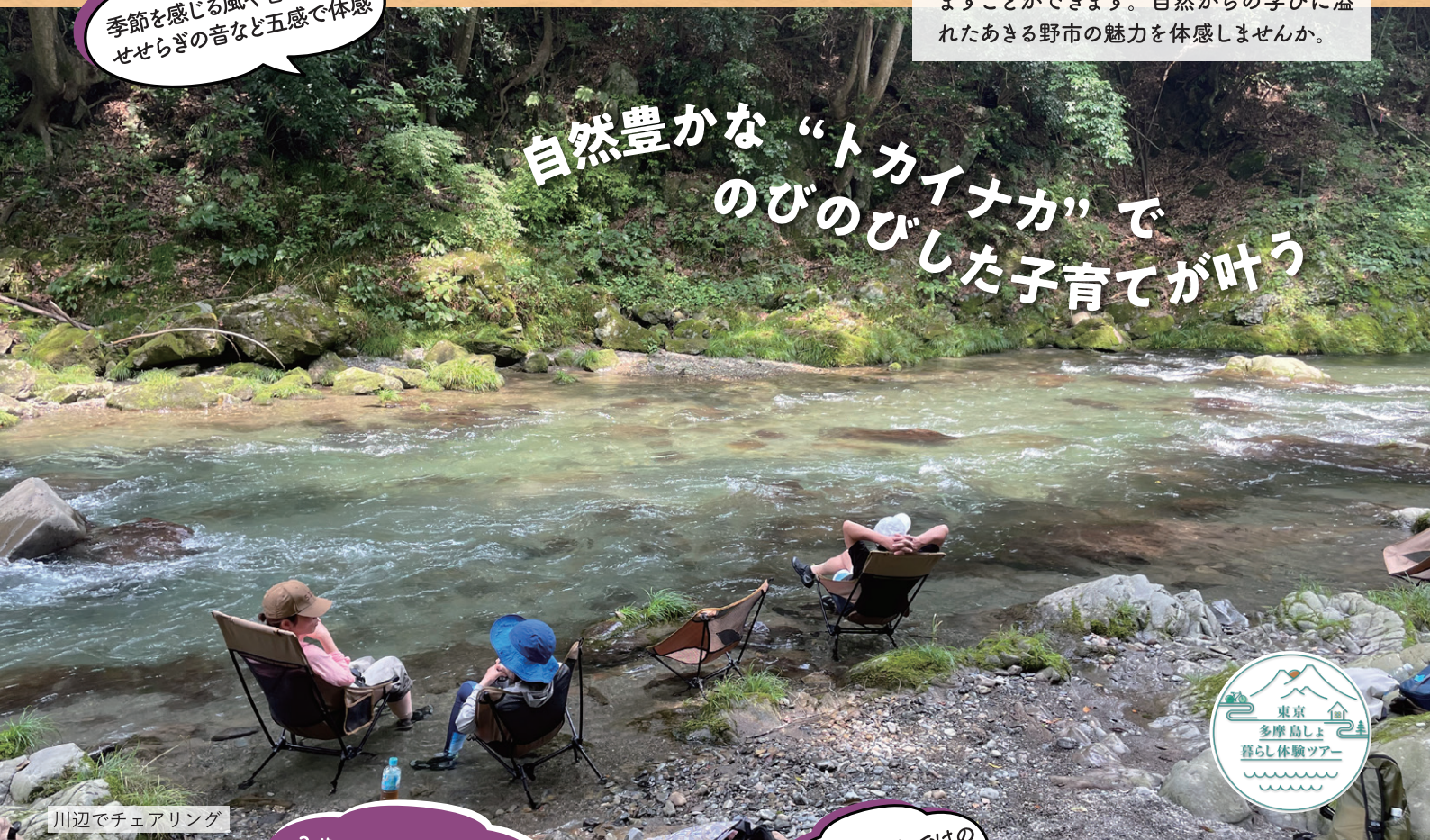
川辺でチェアリング